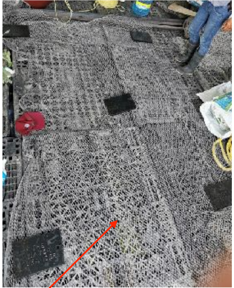
Malla para fijar el TWC